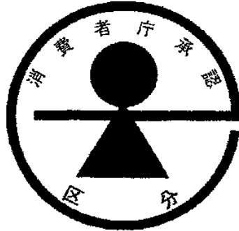
様式第五号（第八条関係）

備考：区分欄には、乳児用食品にあつては「乳児用食品」と、幼児用食品にあつては「幼児用食品」と、妊産婦用食品にあつては「妊産婦用食品」と、病者用食品にあつては「病者用食品」と、その他の特別の用途に適する食品にあつては、当該特別の用途を記載すること。