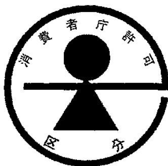
様式第二号 (第八条関係)

備考：区分欄には、乳児用食品にあつては「乳児用食品」と、幼児用食品にあつては「幼児用食品」と、妊産婦用食品にあつては「妊産婦用食品」と、病者用食品にあつては「病者用食品」と、その他の特別の用途に適する食品にあつては、当該特別の用途を記載すること。