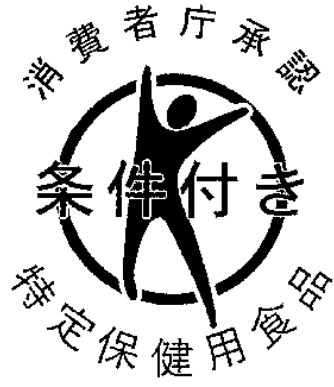
様式第七号（第八条関係）