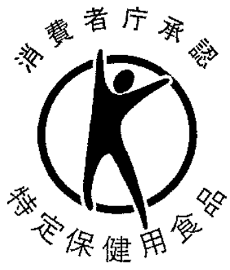
様式第六号（第八条関係）