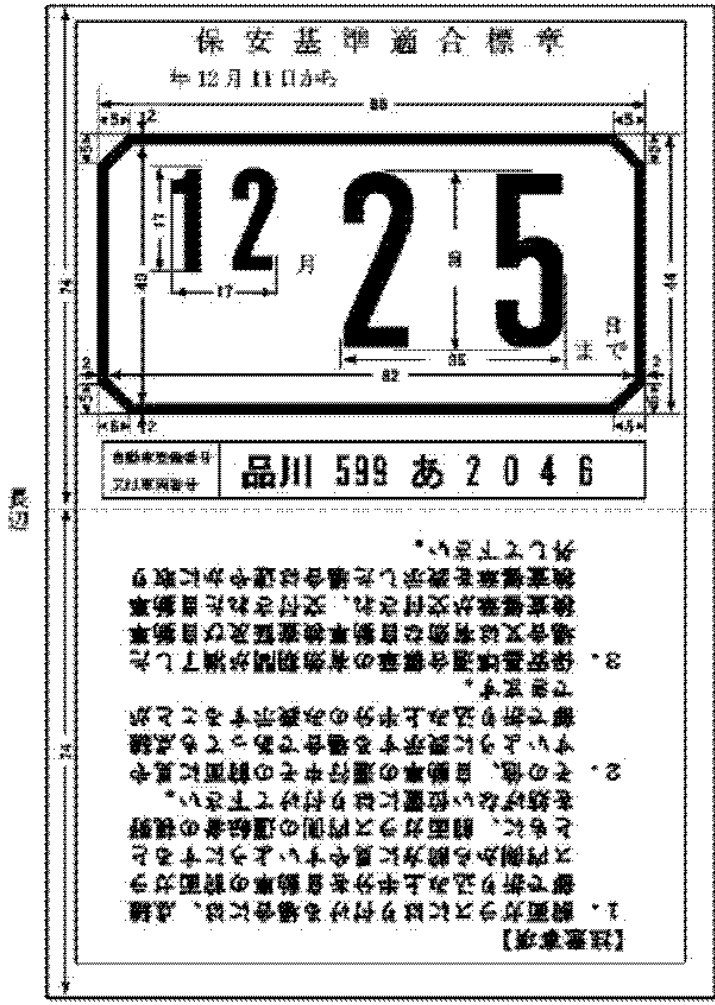
短辺（日本産業規格 A 列 6 番）