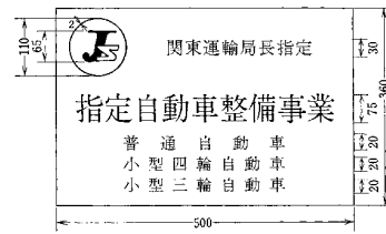
第五号様式（指定自動車整備事業者の標識）（第十五条関係）（昭38運令第3・昭42運令の一部改正、昭44運令第7・自第2号様式採下、昭46運令第33・昭53運令7の一部改正、昭58運令8・同第2号様式採下、昭59運令10の一部改正、平7運令8・同第7号様式採下、一部改正）

備考 (1) 指定自動車整備事業者の標識は、図示の例により、上段に標識及び指定を行った地方運輸局長名を、中段に「指定自動車整備事業」の文字を、下段に対象とする自動車の種類をそれぞれ表示すること。この場合において、対象とする自動車の種類は、次の区分により表示すること。