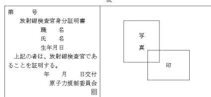
別記様式第 56（第41条関係）（平24文科令6・改正・旧様式第五十四條下、平26文科令6・平30原子標1・令和原子標3・一部改正、平30原子標11・旧様式第五十九條上・一部改正）