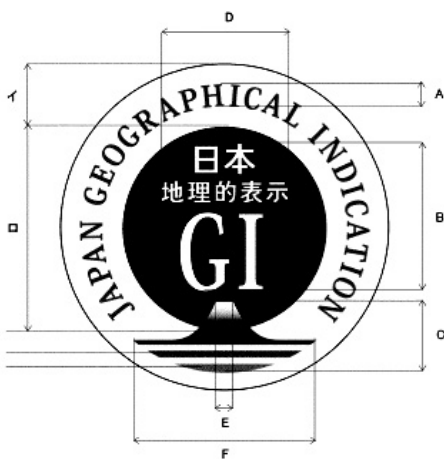
様式二(第四条関係)