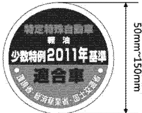
様式第十五の二（少数特例表示）（第二十条第一項第二号イ関係）（平26経産国交環 省令1・全改）