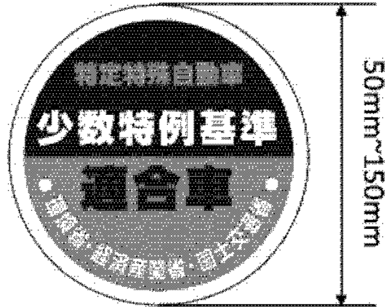
様式第十五（少数特例表示）（第二十条第一項第一号関係）（平26経産国交環省令1・全改）