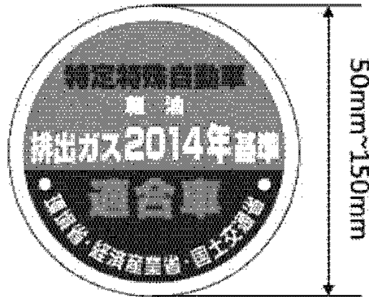
様式第八の二（基準適合表示）（第十六条第一項第二号関係）（平26経産国交環省令 1・全改）