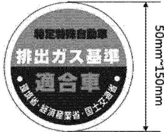
様式第八（基準適合表示）（第十六条第一項第一号関係）（平26経産国交環省令1・全改）