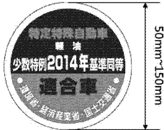
様式第十五の三（少数特例表示）（第二十条第一項第二号口関係）（平26経産国交環 省令1・全改）