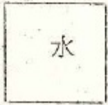
別表第三 水位標横断線拋標及び横断線記号 一 横断線拋標の標石