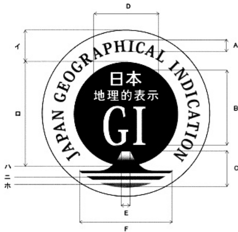
様式二（第四条関係）