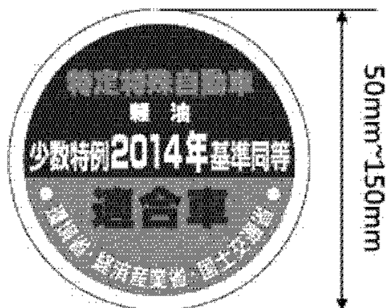
様式第十五の三（少数特例表示）（第二十条第一項第二号口関係）（平26経産国交環 省令1・全改）