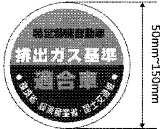
様式第八（基準適合表示）（第十六条第一項第一号関係）（平26経産国交環省令1・全改）