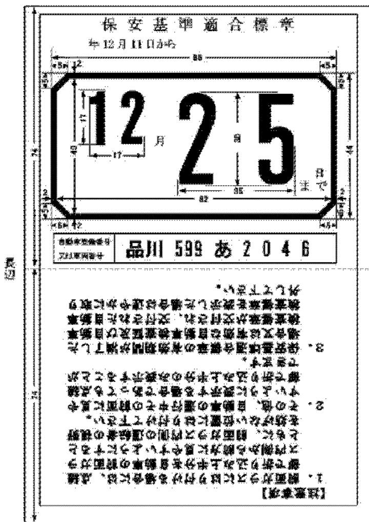
短辺（日本産業規格 A 列 6 番）